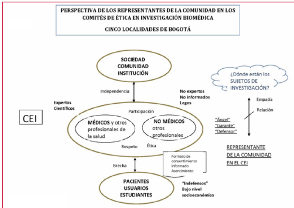
Figura 3. Perspectiva de los Representantes de la Comunidad en los Comités de Ética en Investigación Biomédica