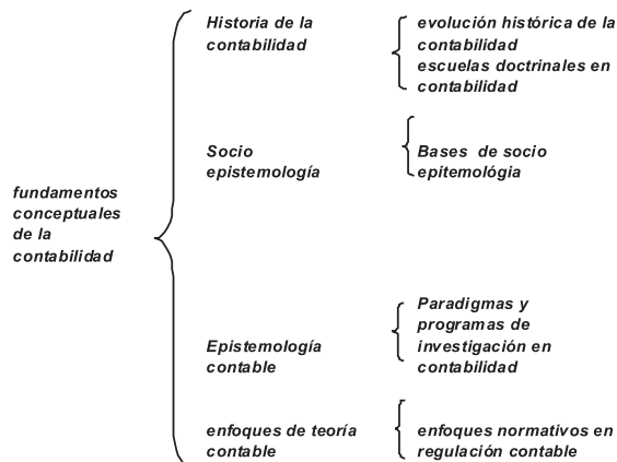
Ilustración 1. Estructura del componente “Fundamentos conceptuales de la contabilidad” (REDFACONT-ICFES; 2006) 2

Sin embargo, es necesario dar cuenta de varias situaciones. En primer lugar, las nomenclaturas de las asignaturas no dan cuenta de los procesos planteados por la propuesta ECAES, en particular, por que