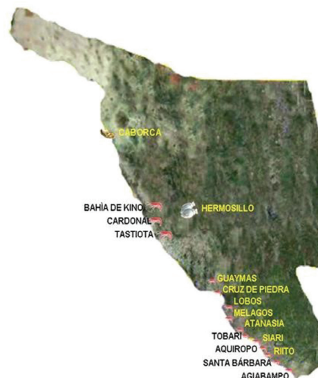
Figura 1. Ubicación de las regiones productoras de camarón de cultivo estudiadas