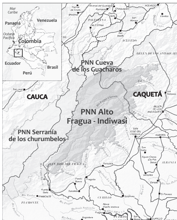
Figura 2. Ubicación geográfica del Parque Nacional Natural Alto Fragua Indiwasi.

puntos de recolección, tales como las presiones antrópicas (asentamientos humanos subnormales) que causan posibles variaciones en la calidad del agua.