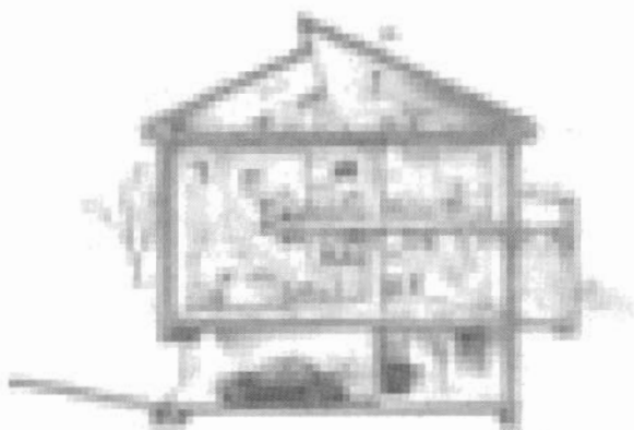
Figura 2. Plano funcional

dio de las demás edificaciones como son: flexibilidad, seguridad, confort y que sean ecológicos; ya que estos se deben integrar con el ambiente exterior e interior para originar un mínimo impacto, además deben procurar aprovechar los diferentes sistemas pasivos como la climatización, ventilación e iluminación en una forma natural y/o complementándose con sistemas electromecánicos eficientes.