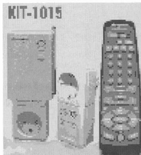
Figura 3. Tecnología X10.

Más adelante se fueron perfeccionando los sistemas, primitivos al principio y mucho más sofisticados más tarde, hasta llegar al momento actual donde fundamentalmente las industrias basan gran cantidad de fases de producción en distintos tipos de elementos automáticos o temporizados, desde el sonido de la sirena de entrada de los trabajadores, hasta el precalentamiento de hornos para que cuando lleguen los distintos operarios encuentren sus puestos de trabajo en óptimas condiciones de rendimiento.