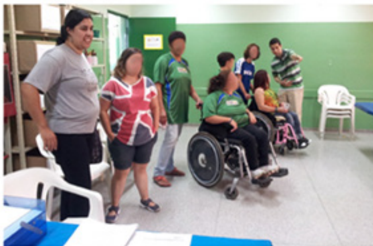
Figura 8. Orientações gerais sobre os Testes com aplicativo.

Essas equipes compareceram ao evento vindas de diversas partes do Estado de São Paulo, entre elas: Suzano, Mogi das Cruzes, São José dos Campos, Baixada Santista, com a presença dos pais, treinadores e do público.