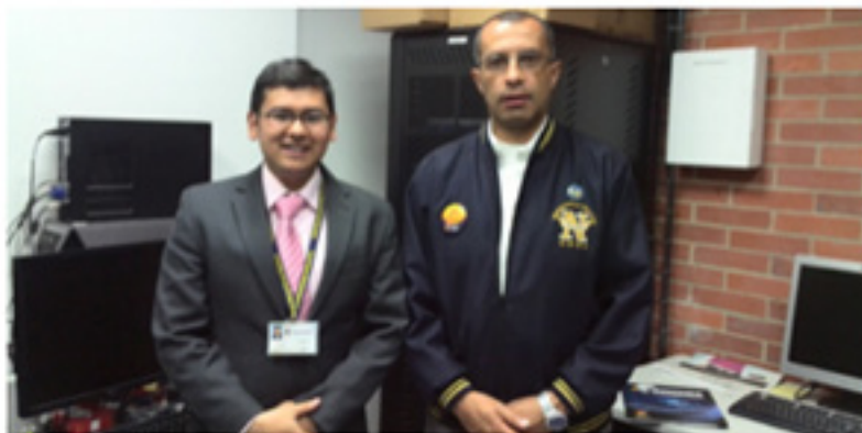
Figura 2. Equipe multiprofissional - TIGUM-Colômbia – equipe 1

A implantação de uma infraestrutura tecnológica adequada proporcionou a construção de um sistema de comunicação entre Brasil e Colômbia para a transmissão de informações para o exercício da telemedicina e telessaúde entre núcleos universitários. Com a instalação e configuração de servidores de arquivos no Brasil e Colômbia, com a validação de aspectos de segurança digital por meio de medições e ataques de interceptação realizados por meio de experimentos científicos no TIGUM da UMNG.