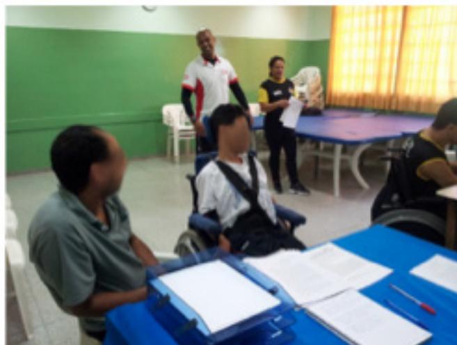
Figura 7. Testes com aplicativo desenvolvido

evento da etapa do Campeonato Paulista de Bocha Adaptada realizada em março de 2014, no distrito de Jundiapéba na cidade de Mogi das Cruzes.