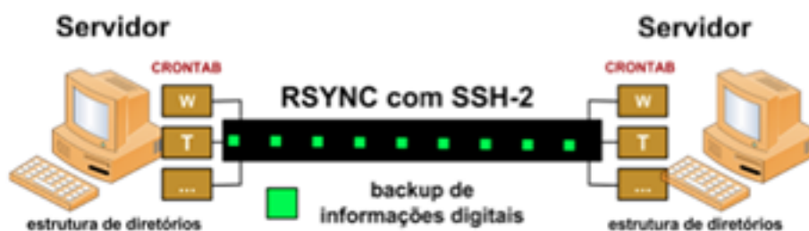
Figura 4. Método de segurança digital em telemedicina

Técnicas de criptografia assimétrica com o uso do protocolo SSH-2 foram incorporadas às transmissões de informações em rede pública como a Internet, em conjunto de processo de assinatura digital e chaves públicas e privadas.