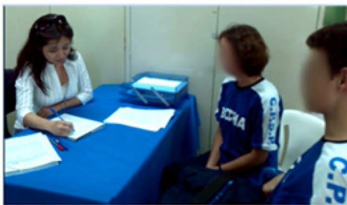
Figura 6. Apresentação de propostas de experimentação de pesquisa aos voluntários

As propostas de experimentação científica foram apresentadas aos voluntários em formato de projeto de pesquisa para o CEP da UMC, para autorização da coleta de arquivos digitais a partir das ofertas de serviços em telemedicina e telessaúde oferecidas.