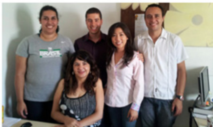
Figura 5. Reunião TRADEF, Lab.SH e TIGUM

As propostas de experimentação científica foram apresentadas aos voluntários em formato de projeto de pesquisa para o CEP da UMC, para autorização da coleta de arquivos digitais a partir das ofertas de serviços em telemedicina e telessaúde oferecidas.