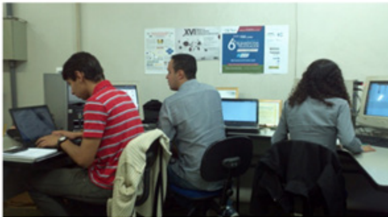
Figura 1. Equipe multiprofissional - Lab.SH-Brasil – equipe 3.

As equipes 1 e 2 do Lab.SH-Brasil foram definidas profissionalmente por: educador físico, engenheiro biomédico, analista de sistema e médica. A equipe 3 do Lab.SH-Brasil foi formada por profissionais de tecnologia para configuração e implantação de infraestrutura tecnológica multiponto no Brasil, com a participação de: analista de redes de computadores, técnico de rede e analista de sistemas.